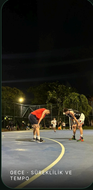
GECE · SÜREKLİLİK VE TEMPO

Bu kareler dekor değil. Semtin basketbolla gerçek ilişkisini gösteriyor: gündüz de oyun var, gece de oyun var. Bu da sponsorun steril reklam değil, doğal topluluk içine girmesi anlamına geliyor.