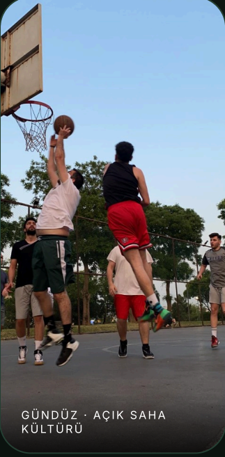
GÜNDÜZ · AÇIK SAHA KÜLTÜRÜ

Aidiyet tarafı, sponsoru duygusal olarak ikna eden alan. Bu kulüp bir boşluğu doldurmuyor; zaten var olan basketbol kültürünü yapılandırıyor.